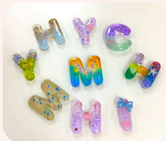
※掲載の画像はイメージです。